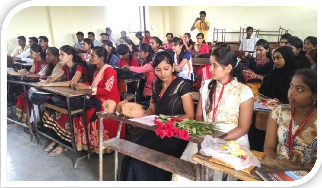
या कार्यक्रमासाठी मराठी विभागातील उपस्थित विद्यार्थी