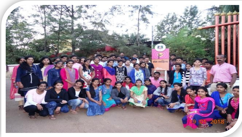
भिलार पुस्तकाचं गाव