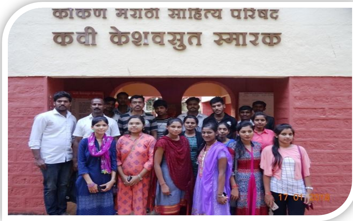
मालगुंड (रत्नागिरी) येथील केशवसुत स्मारकाला भेट