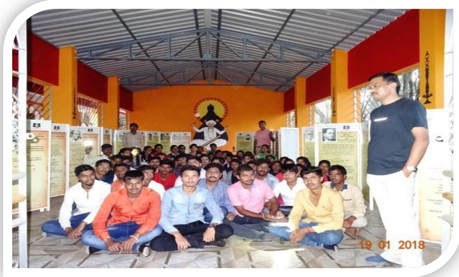
भिलार पुस्तकाचं गाव