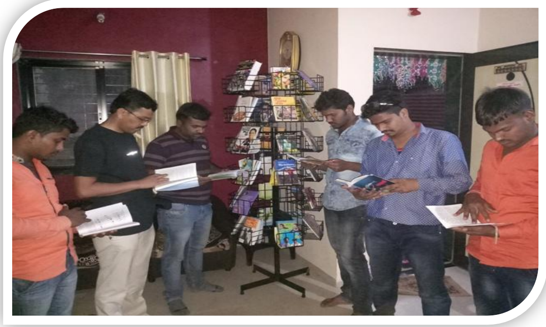
भिलार पुस्तकाचं गावात पुस्तक वाचताना विद्यार्थी