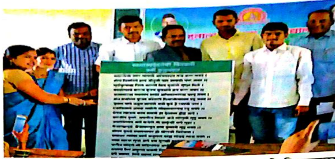
राजगुरुनगर (ता. खेड) : राजगुरु महाविद्यालयात मराठी विभागाला 'स्वातंत्र्यदेवतेची विनवणी' या कवितेची प्रतिमा भेट देताना विद्यार्थी.

डॉ. कसबे म्हणाले, "भाषेत करिअर करायचे असेल तर संवाद कौशल्यांसारखी इतर भाषिक कौशल्य विद्यार्थ्यांनी आत्मसात करणे गरजेचे आहे. आपल्याकडे प्रतिभा, कल्पनाशक्ती, सर्जनशीलता