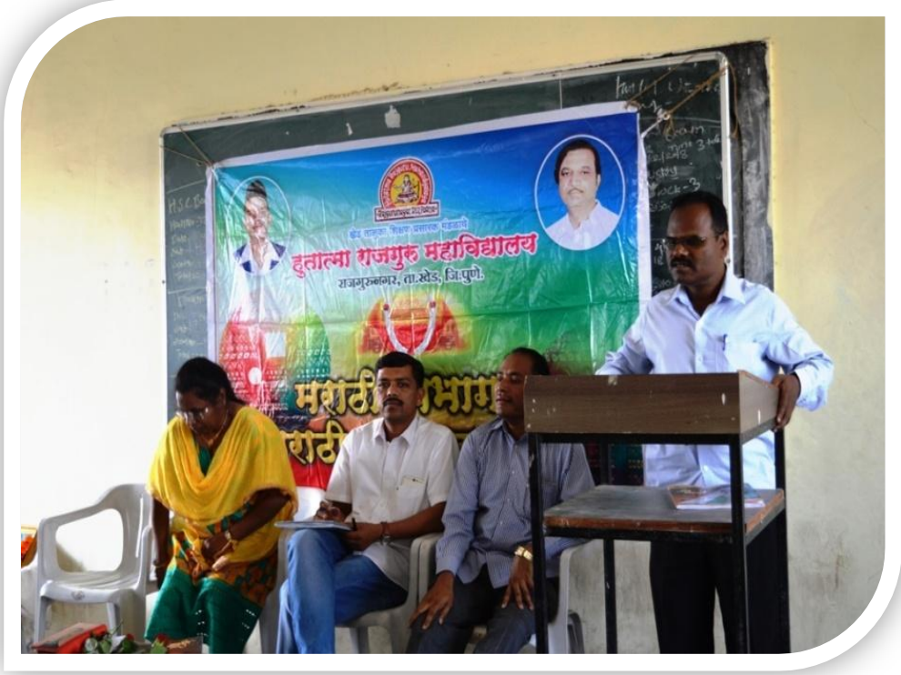
शैक्षणिक वर्ष २०१७ - २०१८ चे तृतीय वर्षाचे विद्यार्थी