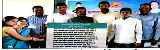
राजगुरुनगर : तृतीय वर्षाच्या विद्यार्थ्यांकडून मराठी विभागास कवी कुसुमाप्रज यांची 'स्वातंत्र्यदेवतेची विनवणी' या कवितेची प्रतिमा भेट देण्यात आली.