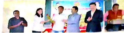
गुणवंत विद्यार्थ्यांचा सत्कार करताना मान्यवर.