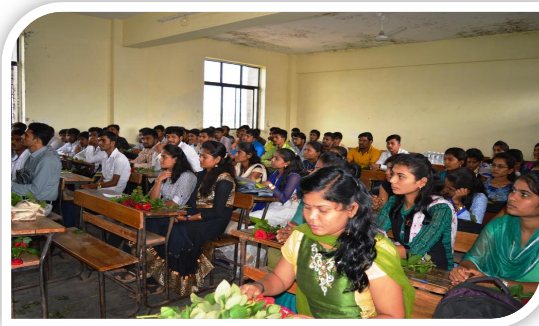
या कार्यक्रमासाठी उपस्थित विद्यार्थी