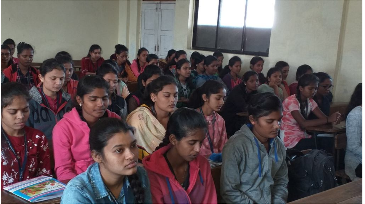
पसायदान सादर करताना विद्यार्थिनी