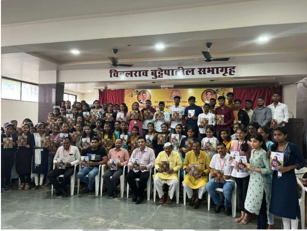
विद्यार्थ्यांना दिवाळी अंक भेट देताना मान्यवर