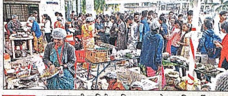
राजगुरुनगर : रानभाज्याची माहिती आणि आस्वाद घेताना विद्यार्थी.