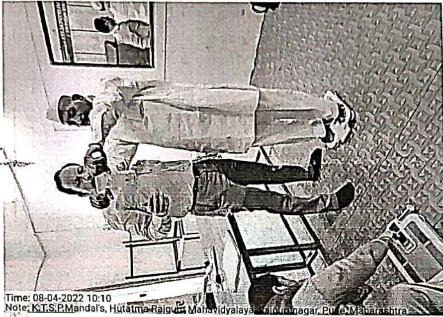
Time: 08-04-2022 10:10 Note: K.T.S.P.Mandal's, Hutatma-Rajguru Mahavidyalaya, Rajgurunagar, Pune, Maharashtra