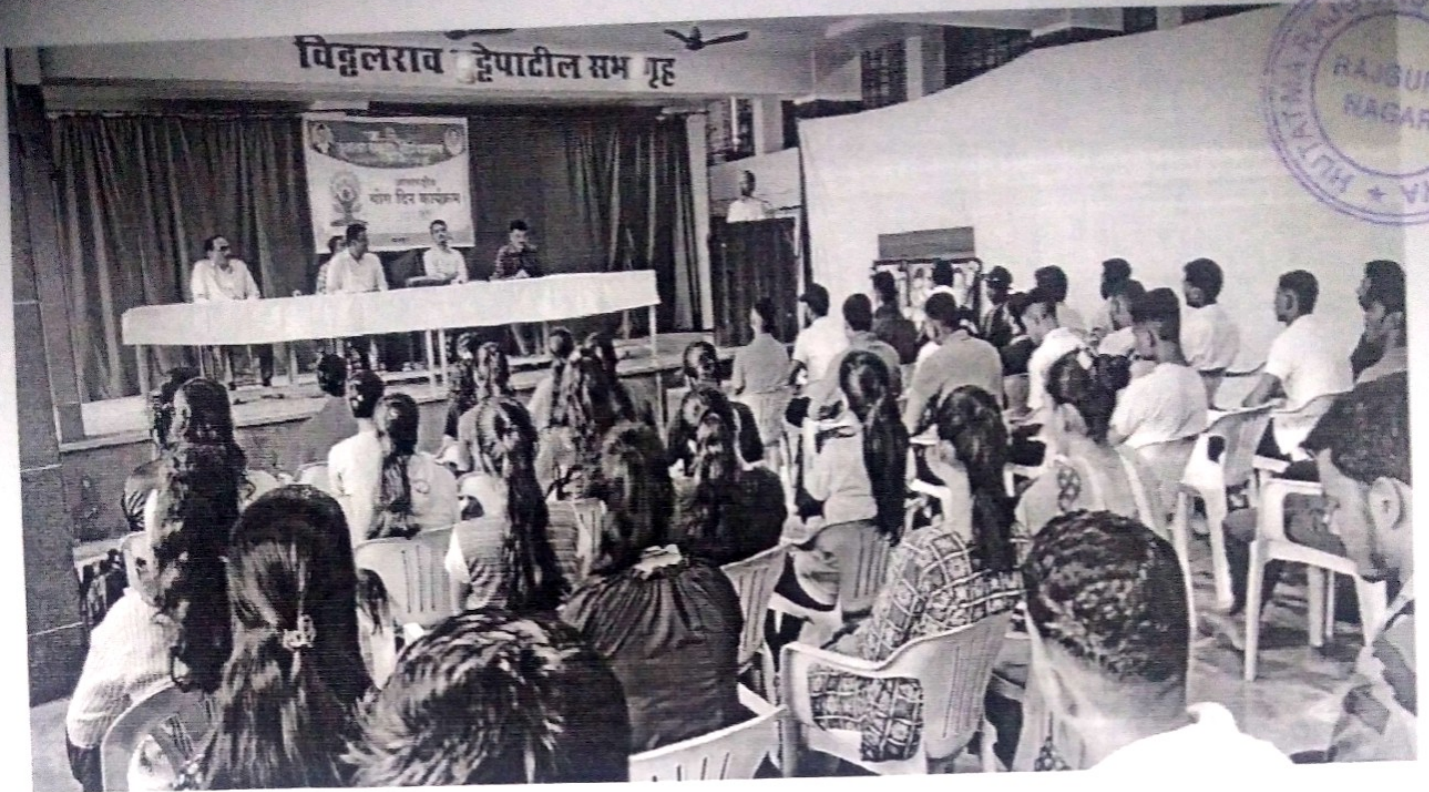
Hon'ble Principal guiding the student